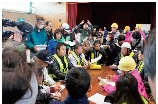
南が丘地区に避難が想定される海岸3地区との合同避難所運営訓練